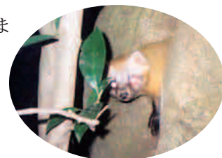
巣穴から顔を出すテン

なお、この調査事例では、あまり見つかったことがないテンの巣穴(広葉樹の樹洞が利用されていた)を確認することができました。