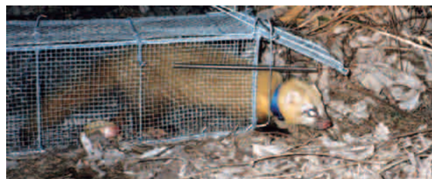
捕獲したテンの放獣

なお、当社では、回収した糞からミトコンドリアDNAを用いて種を判別する技術も有しており、調査技術者個人の経験と最新の分析技術の統合化を図っています。